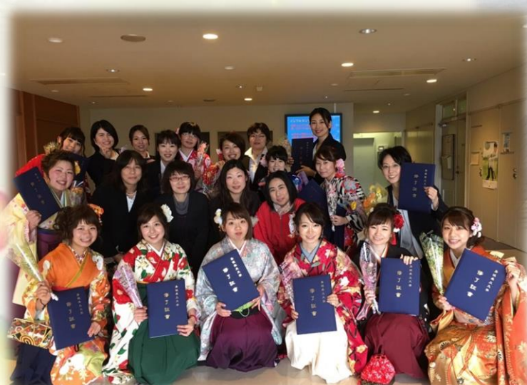
修了式後の集合写真♪大変お世話になりました♪